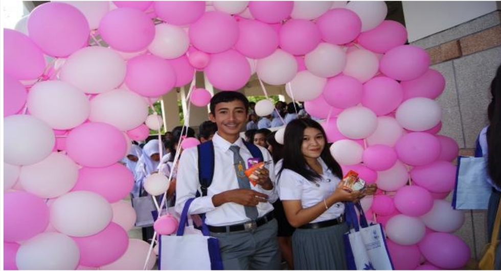
๓ (คลิกเพื่อดูต้นฉบับ) 3.jpg (34.68 kB, 600x401 - ดู 43 ครั้ง.)