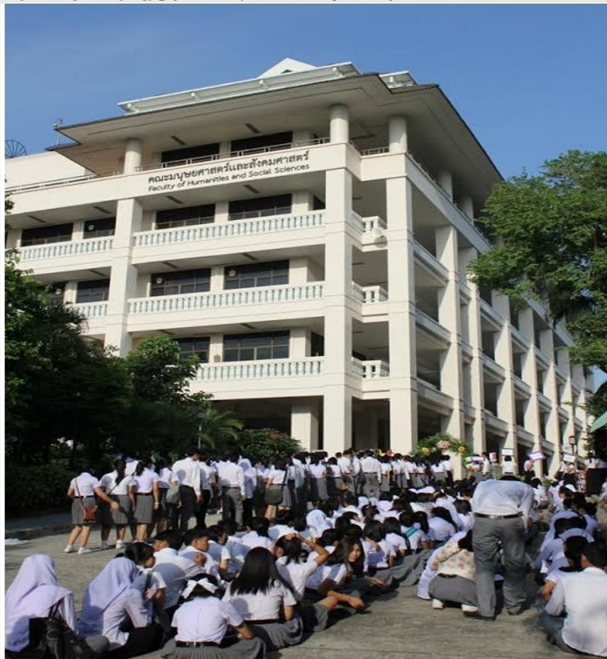
๓ (คลิกเพื่อดูต้นฉบับ) 5.jpg (70.69 kB, 525x787 - ดู 42 ครั้ง.)